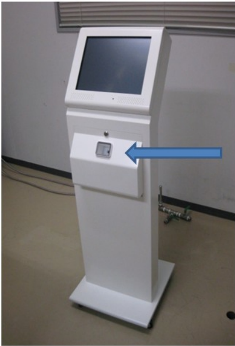
診察待ち時間確認端末